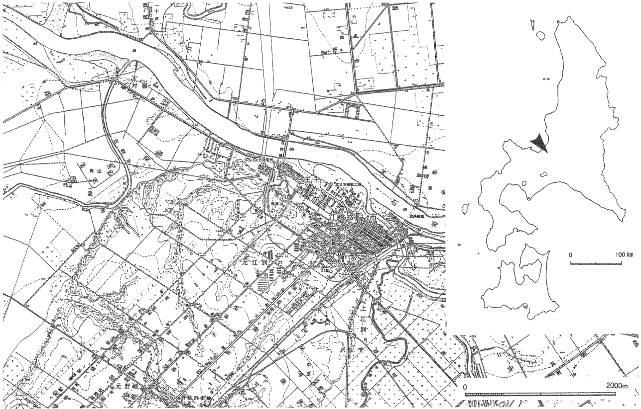
図1 旧豊平川周辺の地形（地理調査所昭和34年発行2万5千分の1地形図「江別」を複製・縮小し一部加筆）

明らかではないが、出土遺構等が記載されない資料が多いことからしても、調査よりやや後の時点のものと推測される。